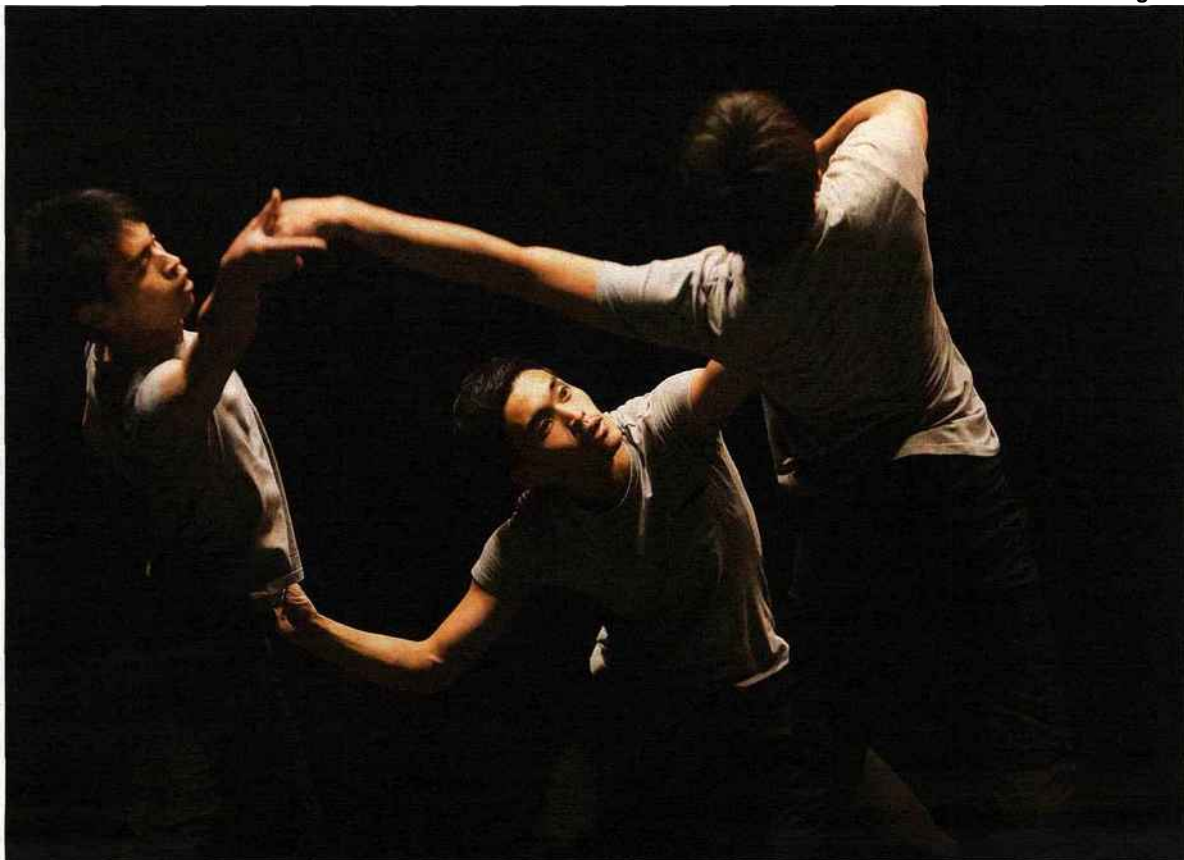
Three For One, Chang Dance Theater