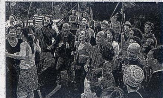
Comme les années passées, la chorale de l'association fera entendre ses voix, au marché Zagreb.

Samedi 12 juin , de 10 h à minuit, animations dans le quartier du Blosne, la place d'Italie à la Poterie. Prix libre. Renseignements : 06 61 75 76 03 ( www.agedelatortue.org ).