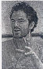
Boris Charmatz, danseur, chorégraphe et directeur du Musée de la danse (centre chorégraphique national de Rennes).